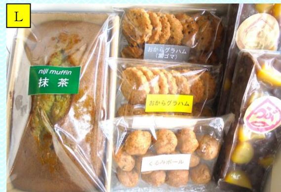
抹茶マフィン&クッキー3種 &栗蒸し羊羹セット