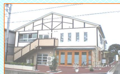
ワークショップハーモニー

心を込めて手作りしておきます。 皆様のご注文をお待ちしておきます。 「安全・安心・良質」