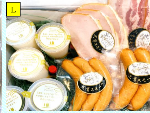
こだわりクリームチーズ豆乳プリン &おまかせスモーク4種セット

プレーンマフィン、フルーツマフィン、クッキー3種（くるみボール・グラハム風おからクッキー・黒グラハム風おからクッキー）