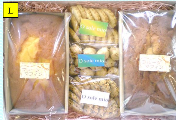
マフィン2本&クッキー3種セット

こだわりクリームチーズ豆乳プリン3個、クッキー3種（くるみボール・グラハム風おからクッキー・黒グラハム風おからクッキー）、フルーツマフィン ※豆乳たまごプリンにも変更できます。