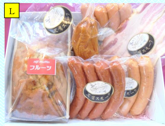
おまかせスモーク5種&マフィンセット

(例)ポークウィンナー、スモークチキンむね肉、ベーコンスライス、あらびきソーセージ、ロースハム、牛肉入り粗挽きウィンナー