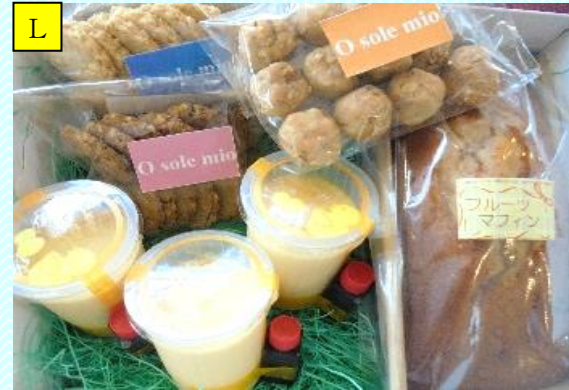
こだわりクリームチーズ豆乳プリン・ クッキー3種・フルーツマフィンセット

抹茶の風味豊かな抹茶マフィン、クッキー3種（くるみボール・グラハム風おからクッキー・黒グラハム風おからクッキー）、自家製栗蒸し羊羹（つぶあん2本）