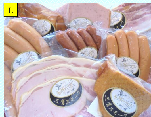
おまかせスモーク特選セット

(例)フルーツマフィン、スモークチキンむね肉、ベーコンスライス、ポークウィンナー、あらびきソーセージ、牛肉入り粗挽きウィンナー