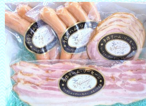
気軽だけどとっても喜ばれる♪ 多摩のおみやげおまかせセット