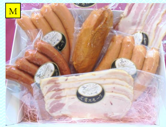
おまかせスモーク6種セット