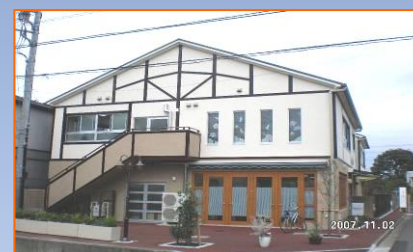
ワークショップハーモニー

心を込めて手作りしております。 皆様のご注文をお待ちしております。 「安全・安心・良質」