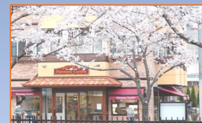
ハーモニーガーデン