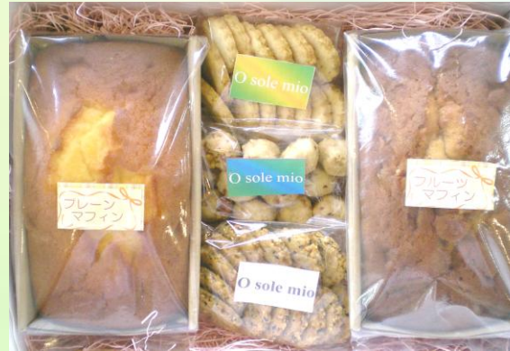
マフィン2本&クッキー3種セット

こだわりクリームチーズ豆乳プリン3個、クッキー3種（くるみボール・グラハム風おからクッキー・黒グラハム風おからクッキー）、フルーツマフィン ※豆乳たまごプリンにも変更できます。