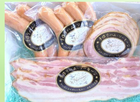
気軽だけどとっても喜ばれる♪ 多摩のおみやげおまかせセット