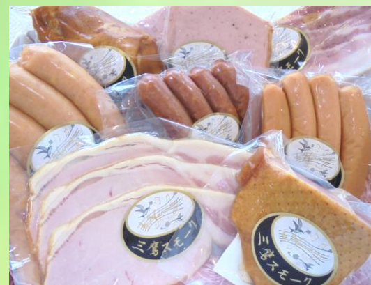
おまかせスモーク特選セット

(例)フルーツマフィン、スモークチキンむね肉、 ベーコンスライス、ポークウィンナー、あらびき ソーセージ、牛肉入り粗挽きウィンナー