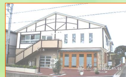
ワークショップハーモニー

心を込めて手作りしておきます。 皆様のご注文をお待ちしておきます。 「安全・安心・良質」