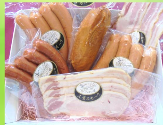
おまかせスモーク6種セット