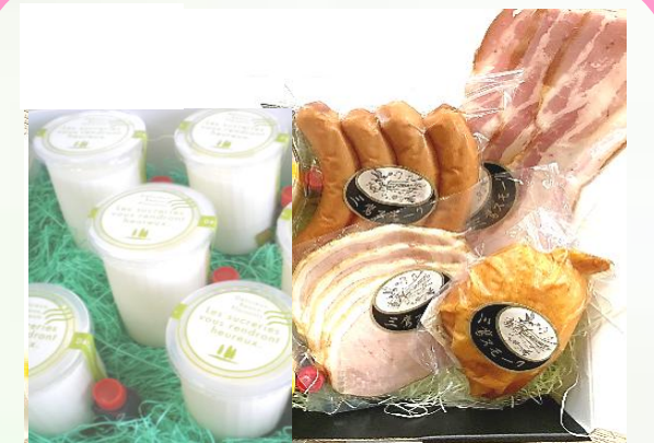
こだわりクリームチーズ豆乳プリン &おまかせスモーク4種セット

原材料：豆乳、クリームチーズ、寒天、グラニュー糖、レモン、ブルーベリー ※豆乳たまごプリンにも変更できます。