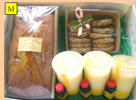
こだわり豆乳プリン&フルーツマフィン・クッキーセット

静岡県島田市産深蒸し茶一八十八夜前の新芽のみを手摘みした一番茶です。長時間蒸すことで渋みや苦味が抑えられ、とてもおいしく体にいいお茶です。 100g 880円 (ジャム) 紅玉 大600円、ルバーブ 大600円、フルーツマフィン