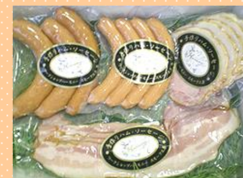
気軽だけどとっても喜ばれる♪ 多摩のおみやげおまかせセット