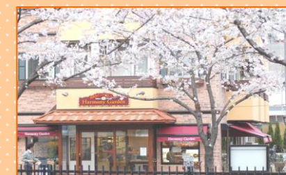
ハーモニーガーデン