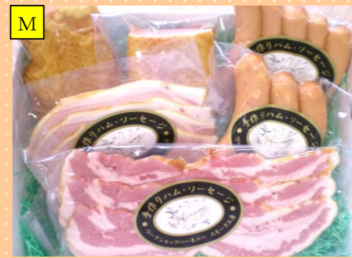
おまかせスマーク6種セット

(スモーク製品の食品添加物は、ハーモニー製品の「安全・安心・良質」の考えの基に、必要最小限の使用にしておりますので、賞味期限を2週間に設定しております。商品は安心してお召し上がり頂けるよう、製造しております。)