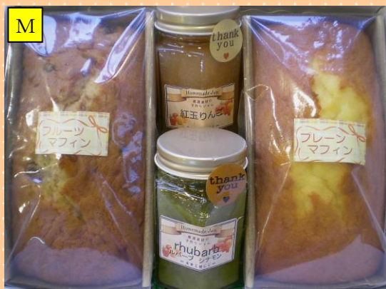
マフィン2本&ジャム(小)2本セット