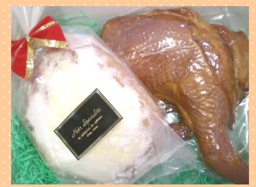
自家製骨付きもも肉のスマーク & クリスマスシュトーレンセット

クリスマスパーティーの主役に！2～3名様でも十分お楽しみいただけるボリュームです