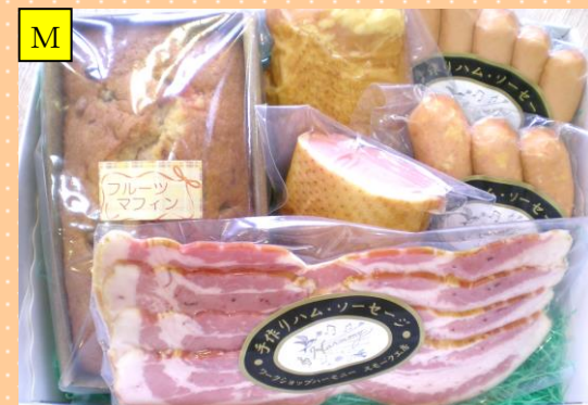
マフィン&おまかせスマーク4種セット

(例) ベーコン、ロースハム、あら挽きソーセージ、スマークチキン(ムネ)、合鴨スマークブロック、ポークウィンナー