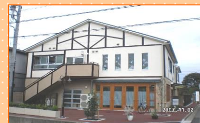
ワークショップハーモニー