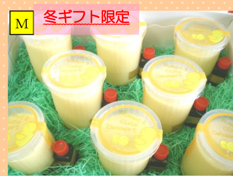
冬ギフト限定 こだわり府中たまご豆乳プリン (洗双糖のカaramelソース付き) 冷蔵

プレーンマフィン・フルーツマフィン・(ジャム) 紅玉 小300円、ルバーブ 小300円、