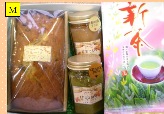
フルーツマフィン&新茶・ジャムセット

●ジャムは未来工房にじ特製。国産の厳選したフルーツで素材の味と香りを引き出しています。