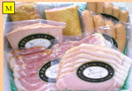
おまかせスマーク特選セット

(例) フルーツマフィン、ベーコン、合鴨スマークブロック、あら挽きソーセージ、スマークチキン(ムネ)、ポークウィンナー