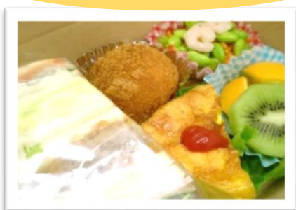
サンド&惣菜 810円(税込み)