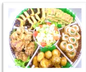
オードブル盛り合わせ