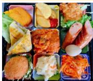
ハーモニーオードブル 1000円(税込み)